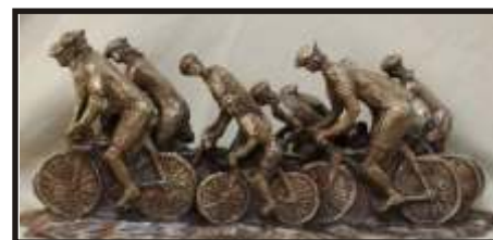
Oeuvre de Carole Desgagnés