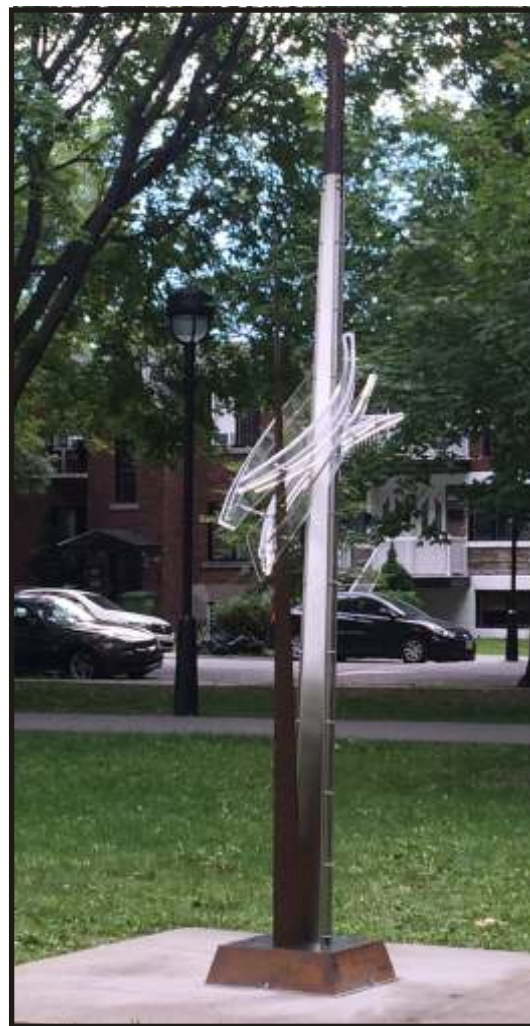
Compassion Oeuvre de Jean-Yves Côté

Ce projet a été financé dans le cadre de l'entente sur le développement culturel de Montréal conclue entre la ville de Montréal et le gouvernement du Québec.