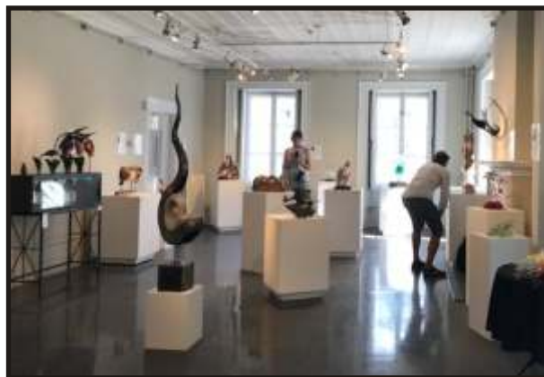
Galerie Ema, Trois-Rivières