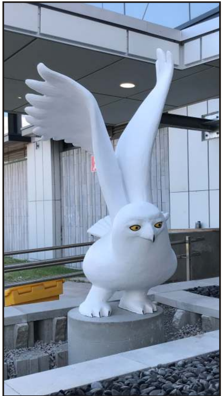
Le Messenger Oeuvre de Marie-Josée Leroux