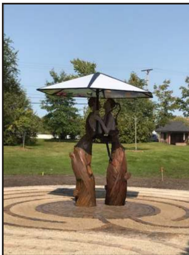
Racines de l'être