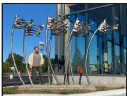
Marcheurs de fleuve de Vasil Nikov